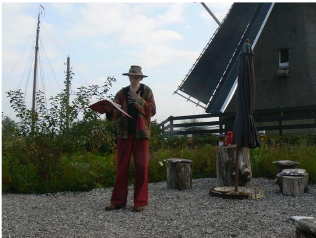
Een impressie van een heel sfeervolle dag met voordrachten en muziek