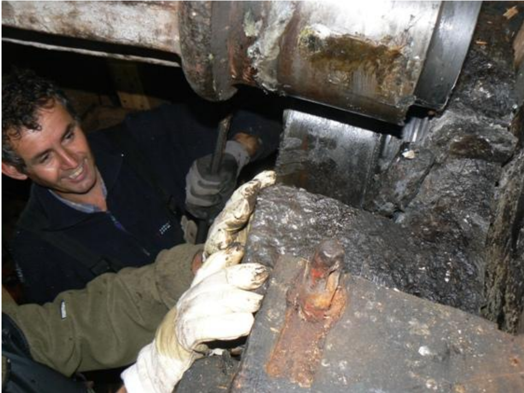
De as wordt gelicht om de oude pensteen te kunnen verwijderen