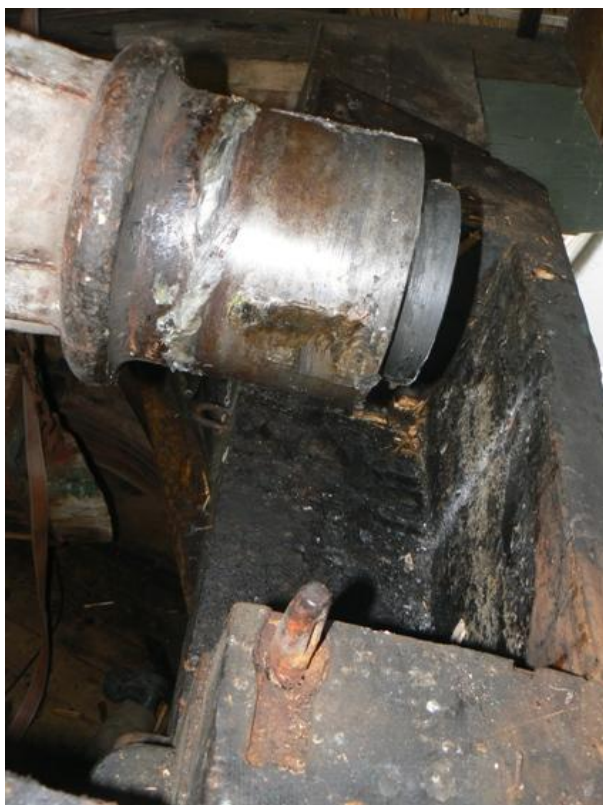
De oude steen is verwijderd