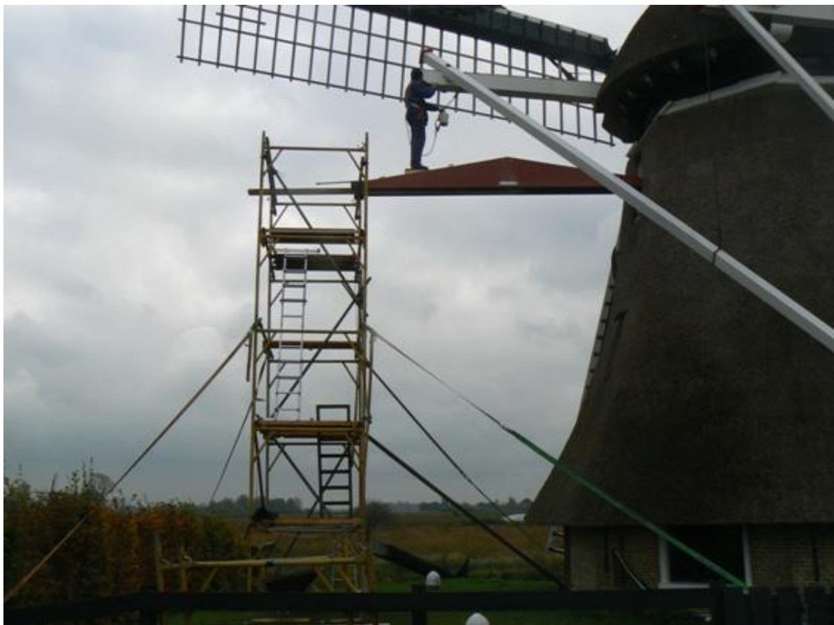
De "tower bridge" in Nijetrijne....

Door de kap te kruien worden andere delen van het houtwerk bereikbaar.