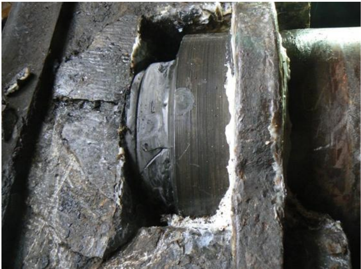
De oude pensteen vertoont grote scheuren

De pensteen is tijdens de restauratie niet vervangen. Er zat hout overheen en de steen leek nog goed te zijn. Tijdens het draaien bleek echter dat vervanging toch noodzakelijk was.