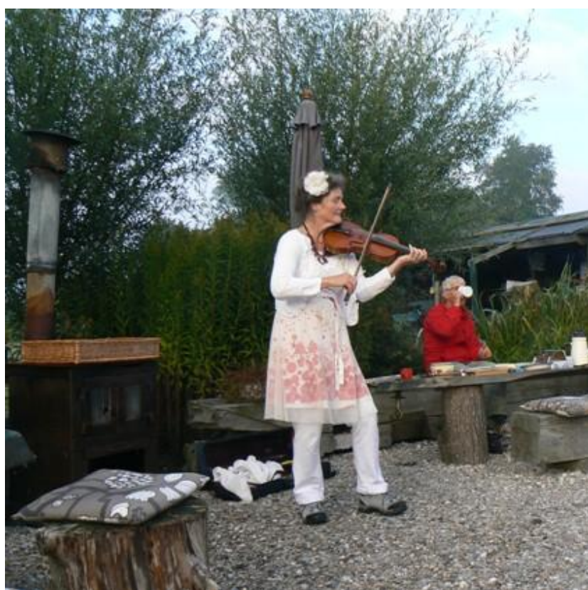
De Rietvink Veendijk 6 Nijetrijne