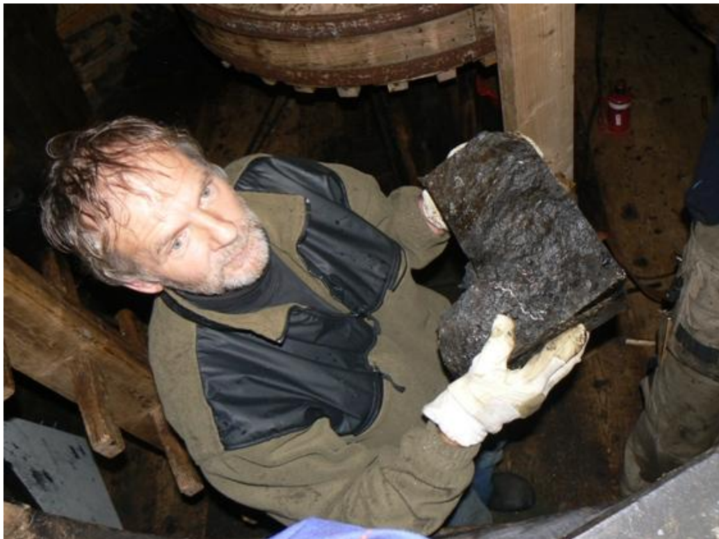
De steen komt er in brokken uit.....