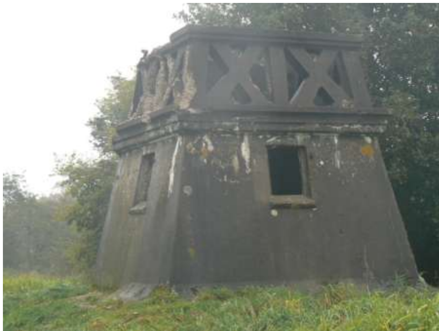
Beeld van de Windmotor eind 2015