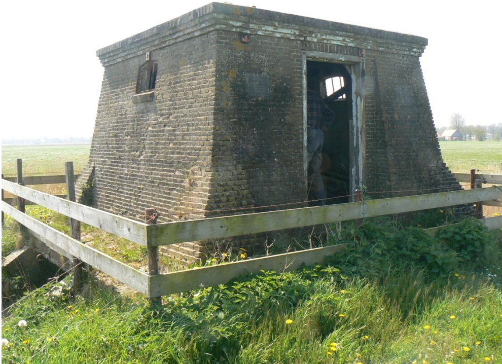
Restant van windmotor in Menaldum; prachtige gemetselde onderbouw!

We hebben met de eigenaar van dit restant overeenstemming bereikt over het verwijderen en hergebruiken van o.a. de lier en een aantal andere onderdelen.